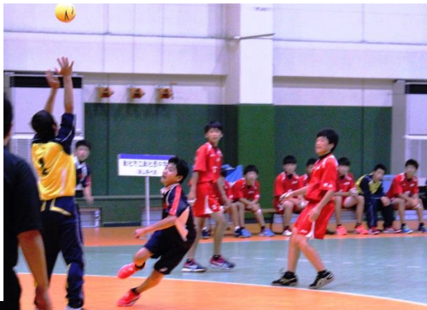
総社西中と予選リーグを戦う甲田中

通算20回を迎えた安芸高田市カップは6月11、12日に湧永満之記念体育館と向原高体育館で開かれた。男子は実力接近で混戦となったが、予選リーグ2位の塩江中が1位の総社西中を下し、5年ぶり2度目の優勝。女子は大阪ジュニアクラブが他を圧倒して2年連続4度目の頂点に立った。